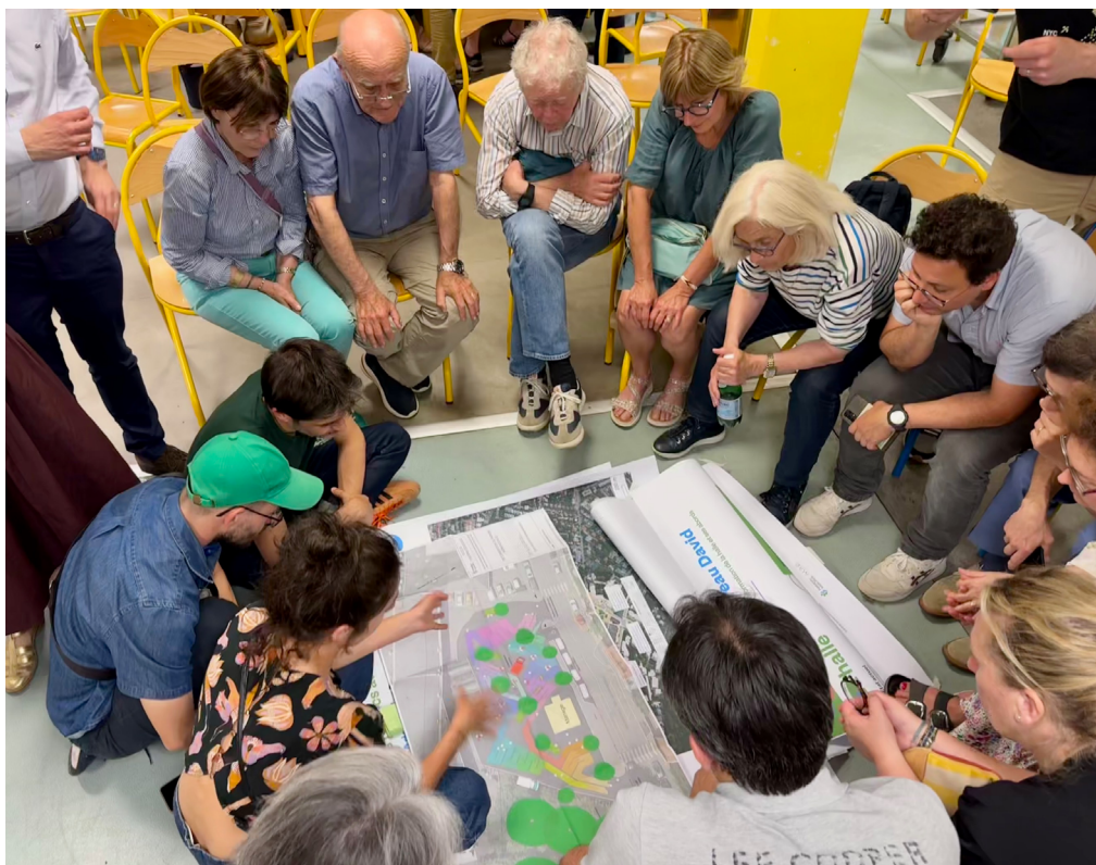
Groupe de travail lors de l'atelier participatif du 12 juin 2025, © Ville Ouverte.

Les décisions finales concernant ce réaménagement se prendront dans le cadre de l'étude de pôle, qui associe la Ville à l'ensemble des partenaires institutionnels du secteur (RATP, IDFM, Conseil Départemental). Les apports de cette étape de concertation seront versés à cette réflexion.