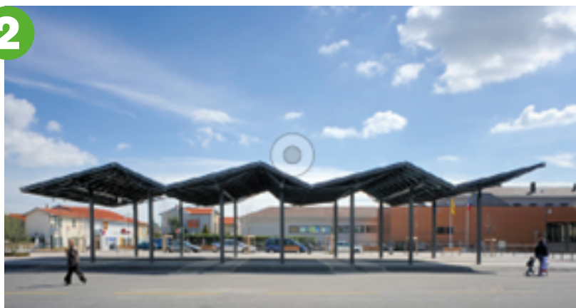
Exemple d'une halle neuve à La Tour-de-Salvagny (69), montrée en référence pendant les ateliers de concertation de juin 2025.