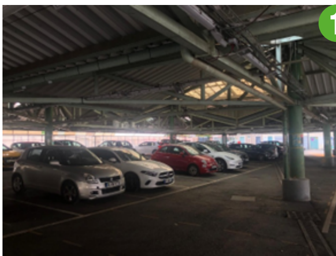
La halle actuelle, © Ville Ouverte.