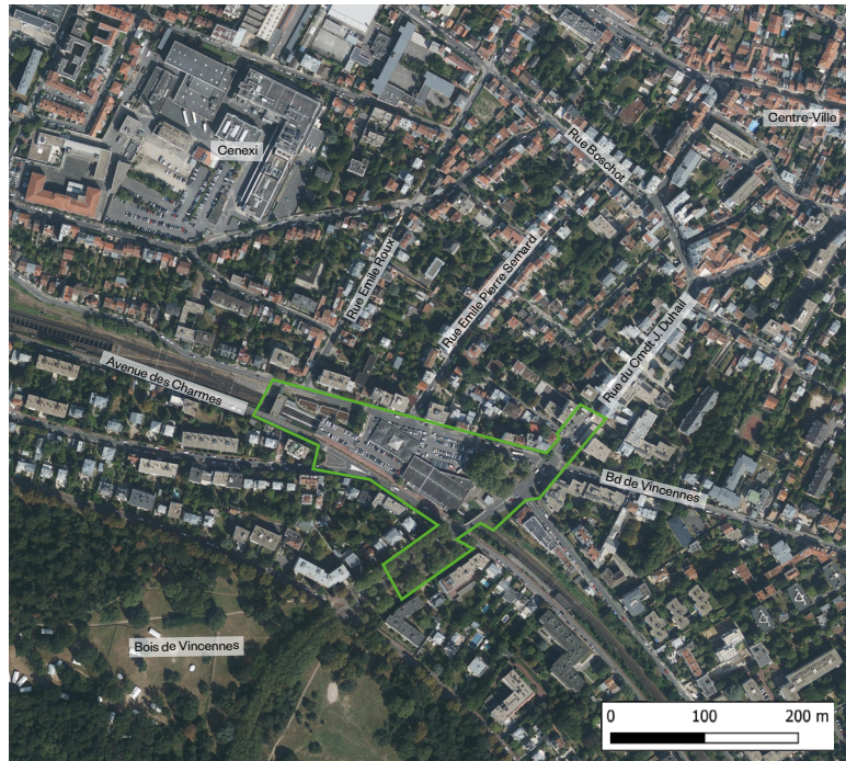
Vue aérienne du périmètre d'intervention.

Concernant la transformation de la halle, les études ont été conduites par la Société Publique Locale Marne et Bois. Elles ont permis de déterminer l'offre commerciale manquante dans le quartier Moreau