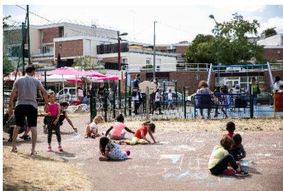
Dessins en plein air aux Larris lors du Village Tour