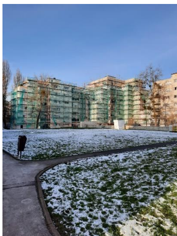
Patrimoine Antin Résidences, quartier Jean Zay

En 2020, de nouveaux audits énergétiques ont été réalisés à la salle Jacques Brel, et les panneaux solaires thermiques de la piscine ont été remis en état et produisent de l'électricité.