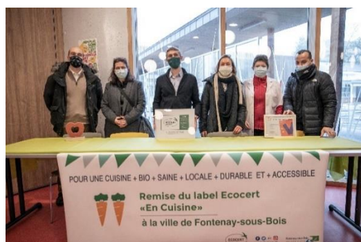
Remise du label Ecocert « En cuisine » niveau 2

La ville de Fontenay-sous-Bois a été audité à l'automne 2020 par l'organisme de certification Ecocert en vue de l'obtention du label « Ecocert en cuisine ». Le label garantit l'utilisation de produits biologiques et locaux, la qualité et l'équilibre nutritionnel des menus, la gestion environnementale du site, une information claire sur les prestations, les démarches engagées et le niveau de labellisation.