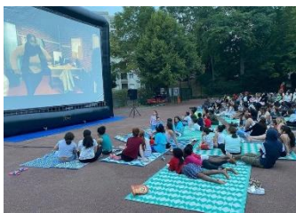
Cinéma en plein air - Village Tour

Les conditions sanitaires à l'été 2020 ont contraint la municipalité à annuler la traditionnelle édition de Fontenay-sous-soleil au parc des Epivans, et préparer une alternative. Ces dispositifs visent habituellement à proposer des activités aux jeunes fontenaysien.ne.s qui ne partent pas ou peu en vacances l'été, et ils ont été particulièrement nombreux cette année en raison des effets économiques de la crise.