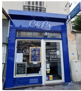
Nouveau restaurant C&C's

Les services municipaux ont par ailleurs accompagné la création de deux nouvelles enseignes ouvertes en 2020, le restaurant C&C dans le quartier Village et le restaurant Hawax aux Alouettes.