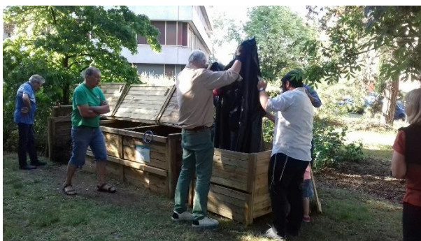
Transfert du compost par les contributeurs rue Henri Wallon

En 2020, malgré l'arrêt temporaire d'installation de sites pendant les périodes de confinement, ce sont 11 nouveaux sites qui ont vu le jour sur la commune. Le maître-composteur intervient également sur les espaces privés de copropriétés. En moyenne 30 à 35 foyers profitent de chaque site. Au-delà, il est proposé d'ouvrir un nouveau site de compostage à proximité.