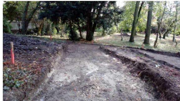
Les travaux d'aménagement au parc des Franciscains