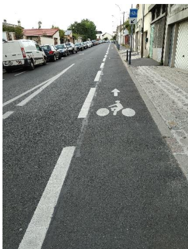
Bande cyclable rue Danton

Fontenay-sous-bois promeut les mobilités durables, un besoin d'autant plus prégnant en cette année de crise sanitaire où l'usage des transports en commun n'était pas recommandé.