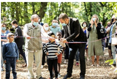
Inauguration du « parcours nature » par Monsieur le Maire et son adjoint à la biodiversité

A l'été 2020 a été inauguré au parc des Epivans un « parcours nature » dans l'espace boisé. Il s'agit d'un aménagement à visée pédagogique, pour la découverte de la biodiversité ordinaire de la ville, et la sensibilisation aux enjeux de préservation de la faune et la flore. L'installation compte 9 stations pédagogiques dont un rucher entretenu par l'association fontenaysienne Abeilles Machine, une prairie fleurie, un module de visualisation des strates