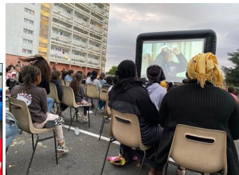
Cinéma en plein air à la Redoute lors du Village Tour