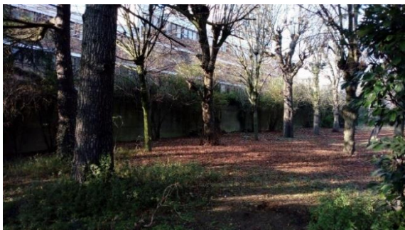
Parc des Franciscains avant les travaux d'aménagement

Le site compte également un bâtiment, acheté par un bailleur social pour être transformé en Centre d'hébergement et de réinsertion sociale. Le projet de CHRS est porté par l'association l'Ilot et s'inscrit dans les ambitions municipales d'accès au droit et de lutte contre la précarité. .