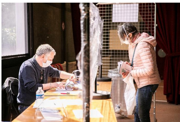
Distribution de masques réutilisables à la population

S'appuyant sur la démarche d'appel à volontaires parmi le personnel communal pendant les plans canicule, des agent.e.s de tous services se sont mobilisé.e.s ponctuellement pour assurer les livraisons de repas à domicile, les distributions de masques à la population ou encore la distribution des chèques solidaires notamment.