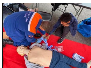
Apprentissage des gestes de secours – Village Tour