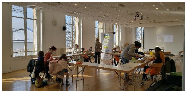
Atelier du défi Familles Zéro déchet

Ce défi est un outil de sensibilisation et un levier d'action concret, qui favorise également le lien social et la consolidation d'une communauté de riverain.e.s autour des enjeux écologiques.