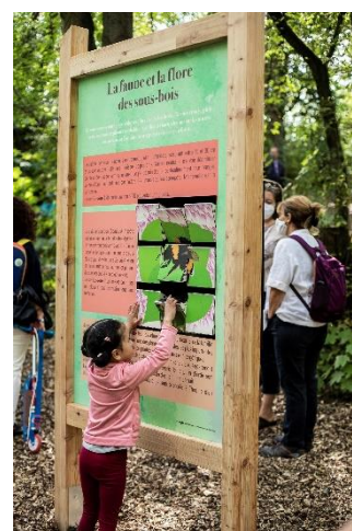
Panneau pédagogique du « parcours nature »

Le parcours a été inauguré le dimanche 6 septembre 2020, à l'occasion des 40 ans du parc des Epivans.