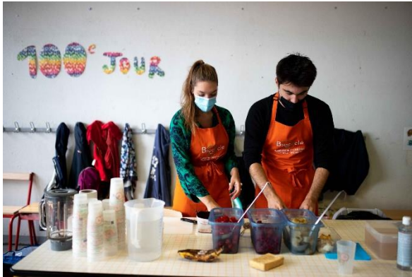
Animation Biocycle sur le gaspillage alimentaire dans les écoles

Dans le cadre de ses engagements pour l'éducation à l'environnement et au développement durable, la municipalité propose diverses activités de sensibilisation aux enjeux écologiques notamment dans les écoles. En 2020, 8 écoles ont accueilli l'association Biocycle sur le temps de la pause méridienne pour une animation pédagogique et ludique pour sensibiliser les écolier.e.s à la lutte contre le gaspillage alimentaire. A l'aide d'un vélo-smoothie, les enfants mixent des fruits « moches » glanés sur les marchés parisiens et qui s'apprêtaient à être jetés, pour en faire des jus vitaminés. Une activité physique pour aborder le gaspillage alimentaire, mais aussi la santé et la solidarité.