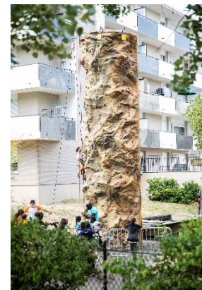
Module d'escalade aux Larris lors du Village Tour

Ainsi, du 14 juillet au 7 août, entre 100 et 300 fontenaysien.ne.s selon les jours (pour une moyenne de 170 personnes/jour) ont profité de cette action. Ils y ont notamment fait du sport, des activités manuelles et des jeux de société, appris les premiers gestes de secours, visionné des films en plein air, partagé des barbecues, etc., dans le respect des règles sanitaires qu'a permis l'organisation de plusieurs villages.