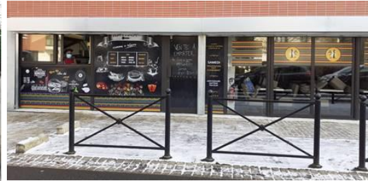
Nouveau restaurant Hawax