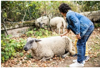
Deux enfants caressent un mouton lors de la transhumance

Fontenay-sous-bois a renouvelé en 2020 l'organisation de la transhumance de moutons à travers la ville. Ce rendez-vous vise à animer la vie de quartier, provoquer une rencontre entre les habitant.e.s, et aborder les enjeux environnementaux et la nature en ville. La municipalité fait appel aux Bergers urbains dont les moutons franciliens pâturent régulièrement dans la région.