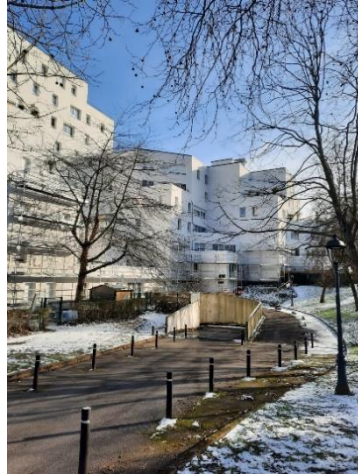
Patrimoine Antin Résidences, quartier Jean Zay