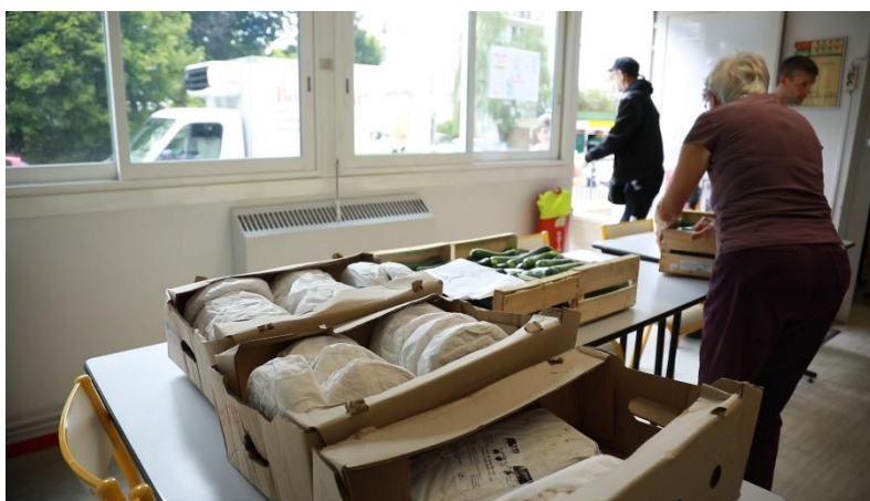
Distribution alimentaire pendant le 1 er confinement

Ainsi, 890 enfants et 490 familles ont bénéficié de 3 distributions de produits alimentaires de qualité dont la livraison a été assurée par des associations de quartier.