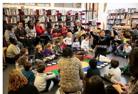
Contes pour enfants à l'occasion de la QSI

Dans le cadre des actions à visée pédagogique et de sensibilisation, la municipalité et ses partenaires ont maintenu en 2020 l'organisation de projections/débats sur le réchauffement climatique dans des classes de terminale, les ateliers autour du festival Africolor pour des classes de seconde et de première, la présentation de l'association Avenir Togo 94 et les ateliers autour du théâtre-forum avec la compagnie Tapataclé en élémentaire. Au total, 18 classes ont bénéficié de ces activités en 2020.