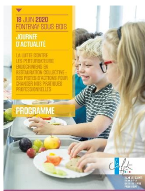
Affiche de la journée d'actualité sur les perturbateurs endocriniens

Engagée depuis 2019 dans la charte « Villes et territoires sans perturbateurs endocriniens », la ville de Fontenay-sous-bois a organisé en 2020 une formation avec le CNFPT et en partenariat avec AGORES 1 sur la lutte contre les perturbateurs endocriniens (PE) dans la restauration collective. Initialement prévue à Fontenay sous la forme d'une journée d'actualité le 18 juin 2020 et compte tenu des contraintes sanitaires liées à la Covid-19, la formation a finalement été proposée en visioconférence durant 4 demi-journées d'atelier les 10, 11, 15 et 16 décembre 2020. Cette formation a réuni par atelier environ 80 agent.e.s de collectivités territoriales françaises autour des interventions de chercheurs, de financeurs, de spécialistes du droit et des marchés publics entre autres. Cette action vise la sensibilisation des professionnel.le.s et la recherche collective de solutions pour éviter l'exposition des convives à ces perturbateurs du système hormonal notamment par les matières plastiques.