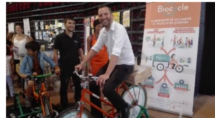
Essai du vélo-smoothie Biocycle par Monsieur le Maire

Les écoles Paul Langevin et Jules Ferry qui n'ont pas encore bénéficié de ces animations accueilleront le vélo-smoothie en avril prochain.