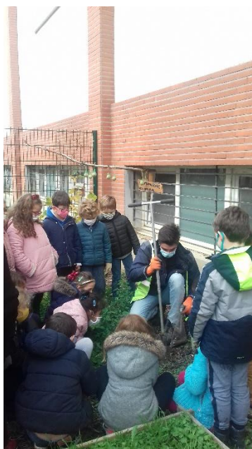
Echantillonnage pour les analyses de sol dans le jardin pédagogique de l'école Jules Ferry

Pour les besoins des plantations ou à des fins de connaissance, la municipalité réalise régulièrement des analyses de sol. Par ailleurs, les administré.e.s et associations fontenaysiennes sont à l'initiative de nombreux projets de potagers urbains et jardins partagés, que permettent la charte « Partageons la ville ». Dans ces espaces et par mesure de précaution, la municipalité recommande la plantation des comestibles en bacs plutôt qu'en pleine terre pour maîtriser la qualité de la terre végétale.