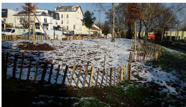
Mini-forêt Rue Lafontaine

Dans le cadre de sa démarche de préservation et développement de la biodiversité, Fontenay-sous-Bois aménage des corridors écologiques pour permettre aux espèces animales de se nourrir, s'abriter, de nicher ou de circuler en sécurité. Dans les zones rurales agricoles, la disparition des haies a entraîné une perte importante de biodiversité. Les cultures ont été dans le même temps privées d'un certain nombre de services écosystémiques rendus par ces espèces. En ville, les routes, immeubles, ponts etc., sont autant d'obstacles pour la faune, et la nourriture y est plus rare. Pour atténuer ces effets, la municipalité travaille à l'aménagement de boisements comme en 2020 rue Lafontaine avec la