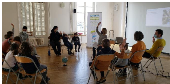
Atelier du défi Familles Zéro déchet