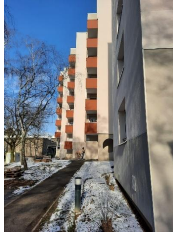
Patrimoine CDC Habitat, quartier Hôtel de Ville