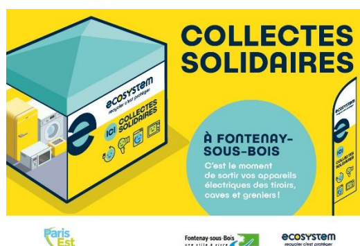
Affiche des collectes solidaires par Ecosystem

En 2020 un nouveau partenariat a été mis en place avec le centre commercial Val de Fontenay pour l'expérimentation d'une collecte à l'est de la ville, sur le parking du centre commercial. Ce nouveau site vise à éviter l'apport de DEEE à la déchèterie située à proximité, dans laquelle les équipements ne sont pas valorisés.