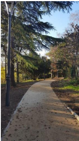
Parc des Franciscains lors de l'ouverture au public

Depuis le 19 décembre 2020, les fontenaysiens profitent d'un nouvel espace vert public de près de 6 000 m 2 en cœur de village. La municipalité a acheté ce terrain privé en 2019 et procédé à l'automne 2020 à des travaux d'aménagement pour permettre d'une part la traversée du parc le long d'une allée reliant deux ouvertures rue Louis-Xavier de Ricard et rue de Neuilly, et d'autre part l'accessibilité aux personnes à mobilité réduite. La création de cette traversée facilite la circulation de la faune et inscrit ce parc dans la coulée verte qui se poursuit à travers le parc de l'Hôtel de Ville vers l'éco-parc des Carrières.