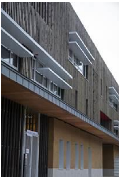
Détail 1 : façade