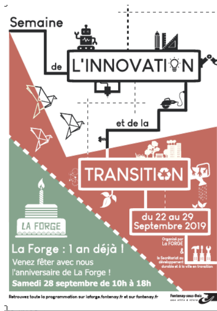
Affiche 2019 de la Semaine de l'innovation et de la transition

La ville a organisé en 2019 la 2ème édition de la semaine de l'Innovation et de la transition, entre le dimanche 22 et le dimanche 29 septembre.