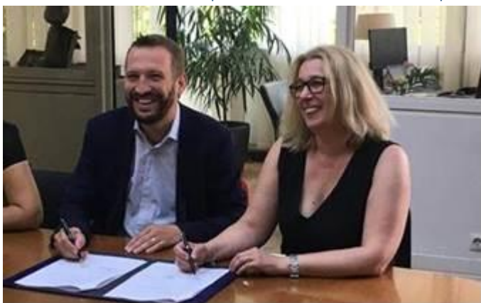
Mr le Maire et la directrice de l'antenne de Pôle Emploi de Fontenay

Le 23 mai 2019, la ville de Fontenay et Pôle emploi ont signé une convention de partenariat formalisant un travail engagé en 2018 pour l'aide à la création d'entreprise. Dans le cadre de cette convention, la mairie de Fontenay-sous-Bois et Pôle emploi proposent aux fontenaysien.ne.s des temps d'information et des ateliers thématiques pour accompagner les personnes éloignées de l'emploi vers la création d'entreprise. En 2019, 24 ateliers ont réuni 150 participants abordant notamment les principes d'une