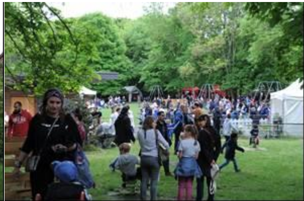
Parc des Epivans

Dans une ambiance familiale, l'évènement a permis également de sensibiliser aux déchets sauvages, au recyclage et à l'économie circulaire.