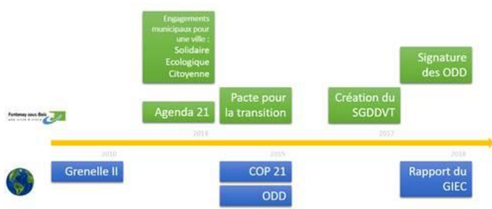
Frise temporelle des ODD