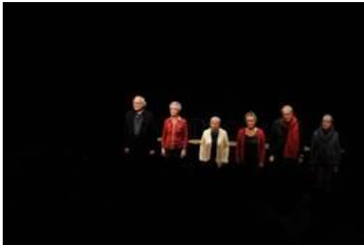
Spectacle Dale Recuerdos

Chaque année, la riche programmation culturelle à Fontenay transmet les questions de société dont se sont emparés les artistes. Les choix des spectacles, concerts, et résidences programmés en 2019 ont mis la lumière notamment sur l'Autre, en tant qu'étranger, en tant que différent, une façon de promouvoir l'acceptation et le respect à travers la culture.