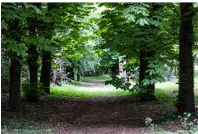
Allée de marronniers du Parc des Franciscains

En novembre 2019, Fontenay-sous-bois a fait l’acquisition dans le quartier Village d’une parcelle d’environ 6 000 m 2 qui appartenait jusqu’alors à la communauté des Franciscains.