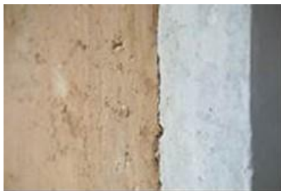
Détail 2 : mur en terre crue

Ce bâtiment est également conçu pour supporter les effets du changement climatique grâce notamment aux toitures végétalisés et aux casquettes pare soleil pour favoriser le confort d'été, grâce à un système d'ouvrants favorisant la ventilation naturelle, et grâce à l'aménagement d'un jardin et d'un rucher pédagogique sur le toit pour lutter contre les effets d'îlot de chaleur urbain et sensibiliser les élèves, le personnel, les parents, et plus largement le quartier à la préservation de la biodiversité.