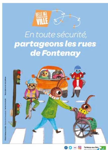
Guide du partage de la rue

Fontenay poursuit son programme d'aménagement et d'accompagnement pour encourager les alternatives à la voiture via la valorisation des modes actifs, l'aide à l'achat de vélos à assistance électrique (VAE), des aménagements de voirie pour matérialiser l'espace de chacun et offrir des points de stationnement pour tou.te.s.