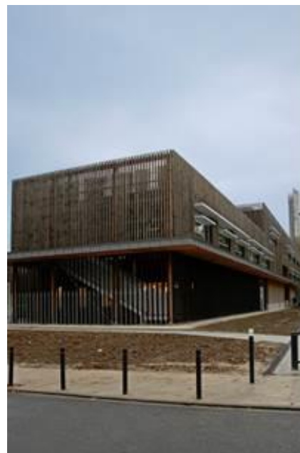
Vue d'ensemble du nouveau bâtiment

Pour limiter son empreinte écologique, la ville a choisi de recourir à des matériaux biosourcés (ossature bois, mur de terre crue) les moins polluants possible (linoléum véritable, peintures et colles sans perturbateurs endocriniens, mobilier réutilisé à 80% pour limiter les composés organiques volatils). L'apport important en lumière naturelle, un taux de renouvellement d'air élevé, le recours aux matériaux précités en font également un bâti exemplaire en termes de santé. Il est équipé de sources d'énergie renouvelable (panneaux solaires sur le toit, mur trombe capteur de chaleur pour limiter les besoins en chauffage).