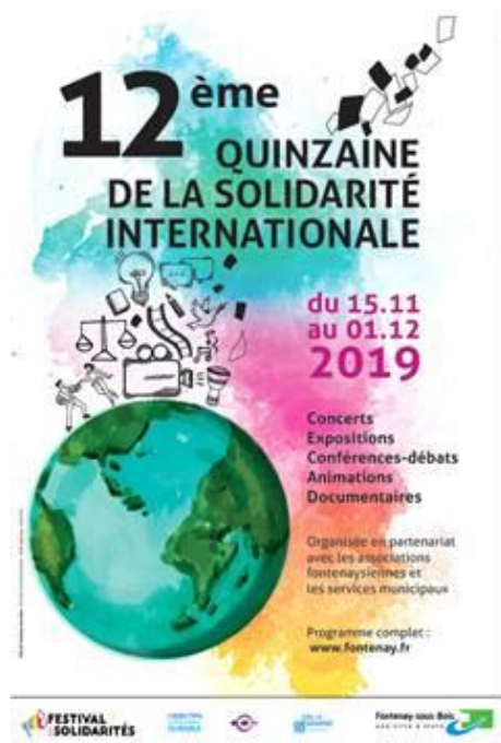
Affiche 2019 Quinzaine de la Solidarité

La 12 ème édition de la Quinzaine de la Solidarité Internationale (QSI) s'est déroulée du 15 novembre au 1 er décembre 2019 dans le cadre national du Festival des Solidarités. Elle a rassemblé 80 partenaires au sein desquels les associations de solidarité fontenaysiennes ont un rôle pivot.