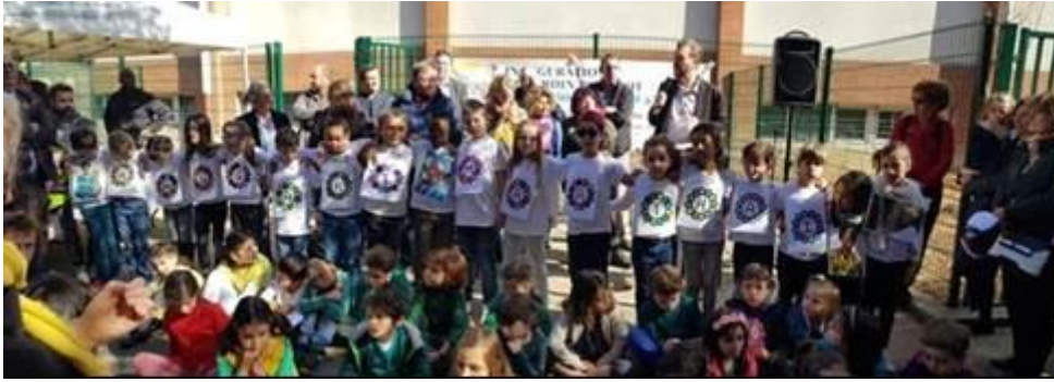
Inauguration du jardin avec les élèves de Jules Ferry

Cet espace est accolé au jardin pédagogique de l'école Jules Ferry, inauguré également en 2019 4 . Ce jardin a été nommé d'après Wangari Muta Maathai, militante écologiste et des droits humains kenyane, dans le cadre d'activités scolaires sur les grandes figures de femmes, en partenariat avec l'association Femmes Solidaires.