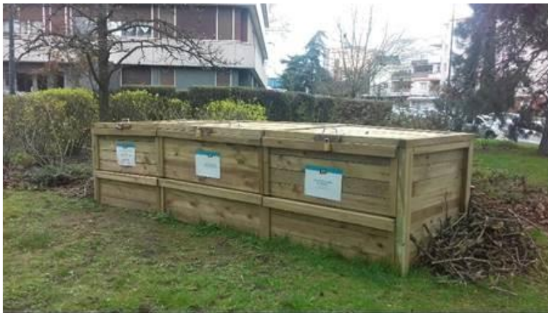
Site de compostage collectif

En partenariat avec le Territoire EPT10 ParisEstMarneBois, Fontenay-sous-Bois encourage et accompagne l'installation de sites de compostage collectif, dans des jardins partagés ou en pied d'immeuble avec un objectif triple de réduction des déchets, de valorisation de ces déchets organiques en ressources, et d'amélioration de la qualité des sols grâce au compost produit. A la demande d'associations et de collectifs d'habitants, en 2019 la ville a inauguré 2 nouveaux sites de compostage collectif, et traité 3 nouvelles demandes en fin d'année.