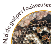
Nid de guêpes fouisseuses

nid dans des anfractuosités (fissures dans les murs...).