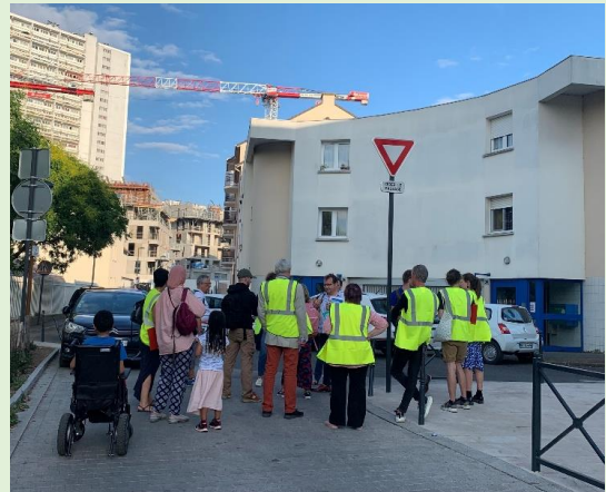
Point d'arrêt rue Lesage

Christine PIGNARRE, SYSTRA , rappelle aux participant.e.s les prochaines dates de la concertation : un atelier le mardi 27 juin et une réunion de restitution après l'été. Elle invite à nouveau les Fontenaysien.ne.s à répondre au questionnaire et se saisir de la carte participative disponibles sur le site internet de la Ville.