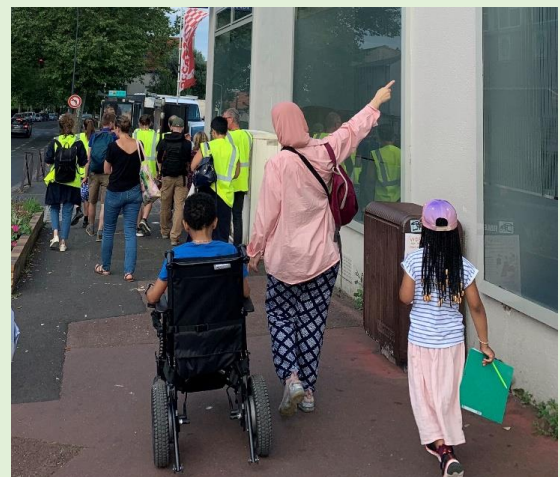
Cheminement boulevard de Verdun