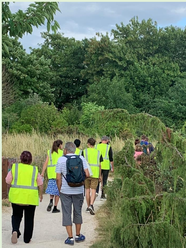
Point d'arrêt Eco Parc des Carrières