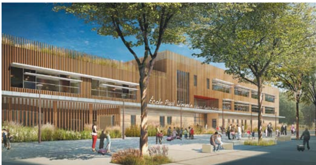
Le bâtiment à énergie positive sera fait de bois et de pisé.

Retrouvez le film sur le nouveau groupe scolaire Paul-Langevin sur le site Internet de la ville : www.fontenay-sous-bois.fr