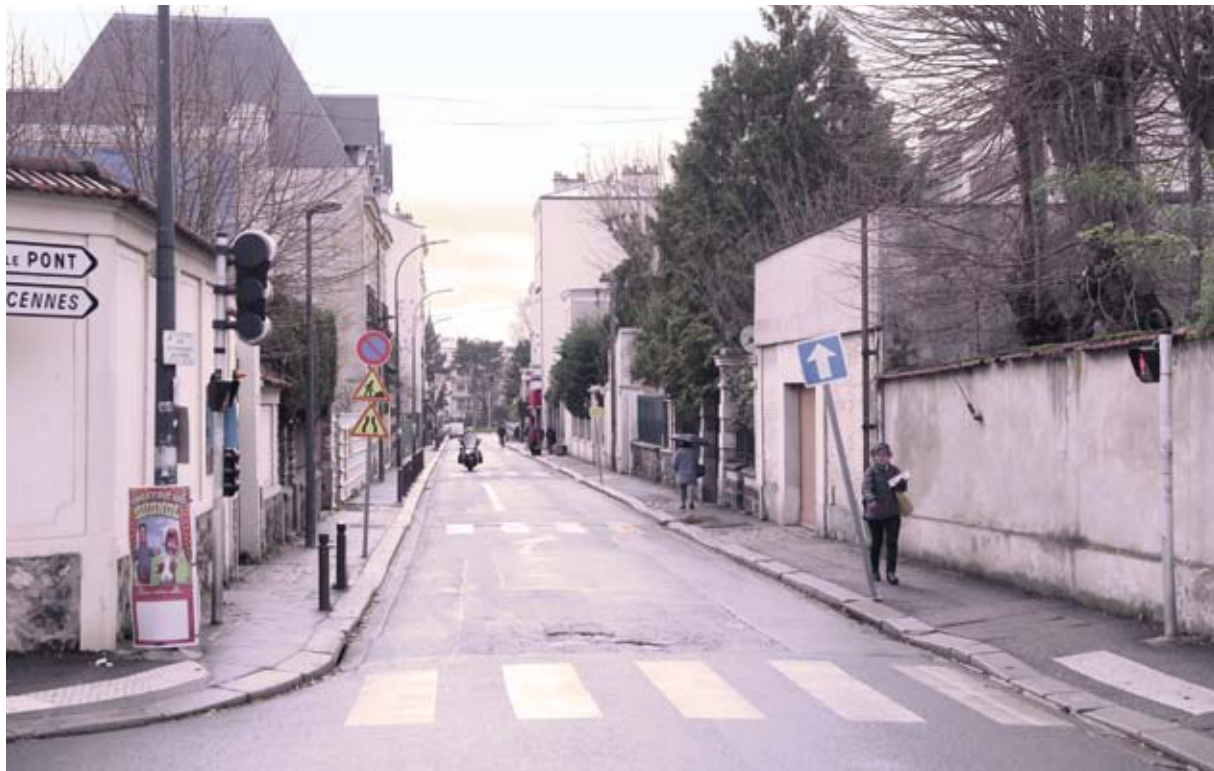
Le sens ascendant (montée) de la rue a été fermé à la circulation jusqu'en novembre 2018.