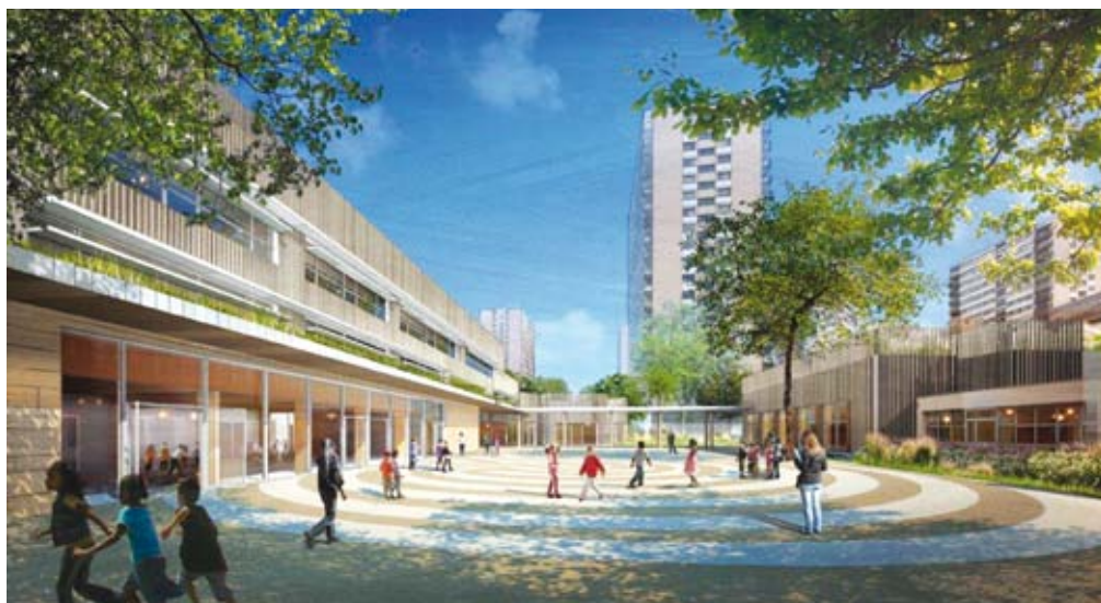
Les cours de récréation seront également réaménagés.