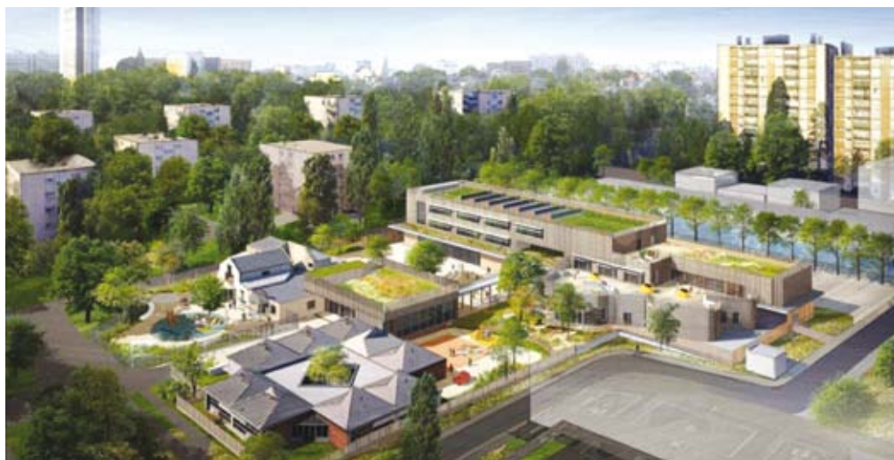
Vue aérienne du groupe scolaire une fois fini.