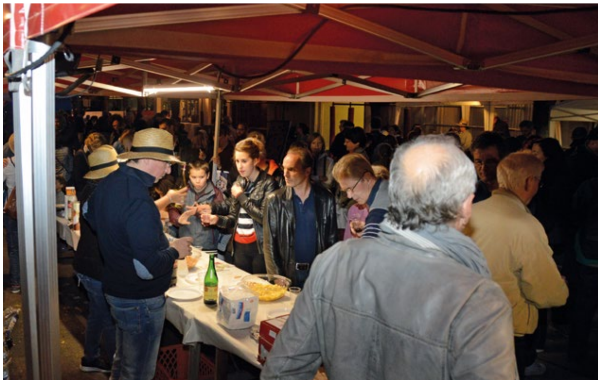
L'association Dynamique Fontenay Village vous convie à son désormais traditionnel apéro Voisins-Commerçants.