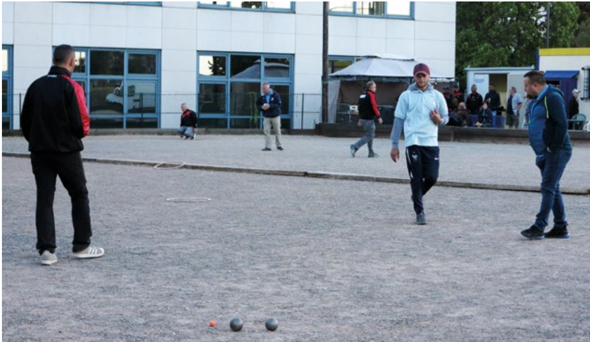
Les Fontenaysiens se sont imposés 8 à 1 en finale départementale (promotion) vendredi 21 septembre au boulodrome de Coubertin.

PÉTANQUE. Les boulistes de l'USF, on vous raconte pas comment qu'ils ont décoiffé ceux de la Villecresnoise en finale du Val-de-Marne, catégorie promotion. Si? Bon, alors on vous raconte. On a frôlé la fanny. L'honneur a été sauf pour les déconfits, mais c'est comme s'il n'était resté à nos marris que les oignons pour pleurer. En tête à tête, ça a été courant d'air sur courant d'air. Du genre à faire concurrence au vent du large: 5 à 1. Mais il a carrément plu de l'acier trempé lors des doublettes; on connaît la chanson: et 1 et 2 et 3 zéro. D'un côté, c'était donc gant