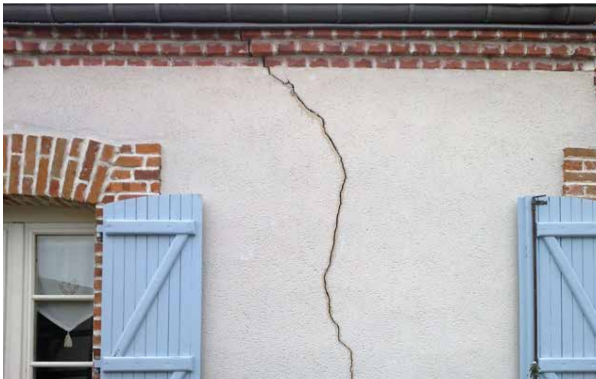
Une demande de reconnaissance de l'état de catastrophe naturelle sera adressée à la préfecture.