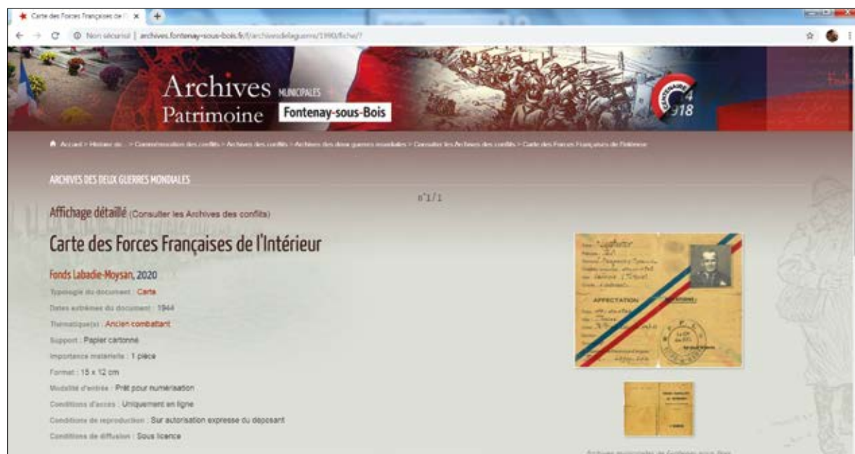
Les Archives municipales vont créer un mémorial numérique sur la 2 nd Guerre mondiale.

Tous secteurs. L'histoire d'une ville, de ses habitants ou des guerres, ne s'écrit pas uniquement à partir de documents administratifs. Les Archives municipales ont aussi vocation à recevoir des archives d'origine privée qui complètent voire dévoilent des pans entiers de ce passé. Il peut s'agir de correspondances familiales, de dessins, de photos, de plans, d'affiches, de cartes postales, de journaux, d'objets... À l'occasion de la création d'un mémorial numérique sur la 2 nd Guerre mondiale, le service des Archives municipales lance un appel à collecte d'archives privées. Vous êtes propriétaire de documents ou d'objets qui témoignent de l'histoire