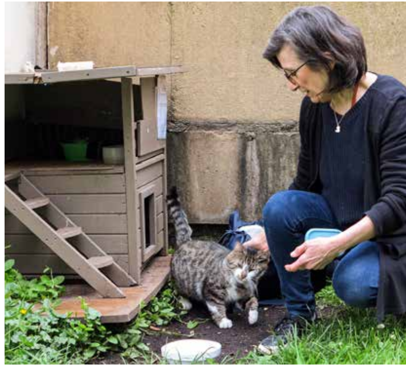
Pendant le confinement, il n'y a pas eu une recrudescence des chats errants en ville.