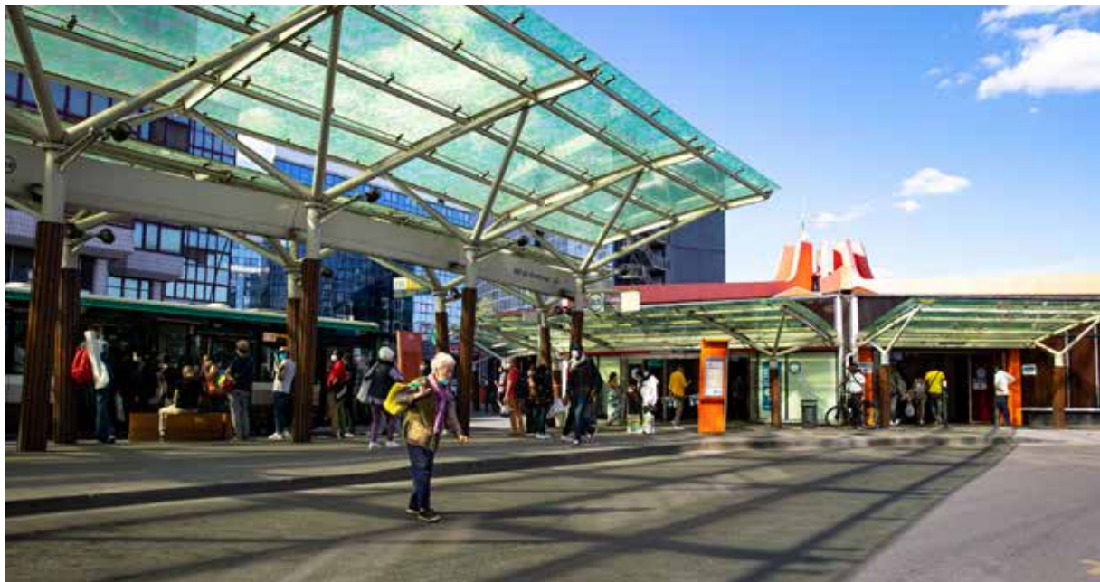
L'échéance de la ligne 15 Est et de la nouvelle gare reste lointaine puisque que les travaux ne seront pas entamés avant 2023.

L'arrêt durant plus d'un mois des chantiers du Grand Paris Express pourrait retarder la réalisation de certaines lignes du super métro automatique. Les grands projets d'infrastructures de transport prévus à Fontenay peuvent-ils être impactés ?