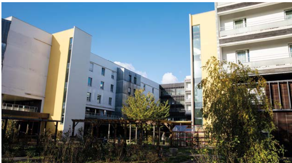
Les 7 et 8 octobre, deux portes ouvertes sont organisées par la MRI.

Les Ehpad de la ville organisent des portes ouvertes à l'occasion de la semaine bleue, événement national qui met à l'honneur les retraités et personnes âgées.