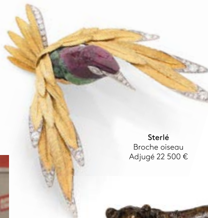
Sterlé Broche oiseau Adjudé 22 500 €