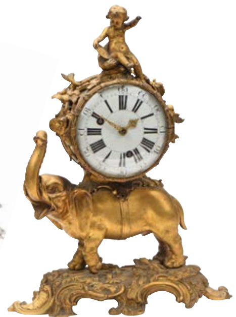
Pendule à l'éléphant Adjudé 37 700 €