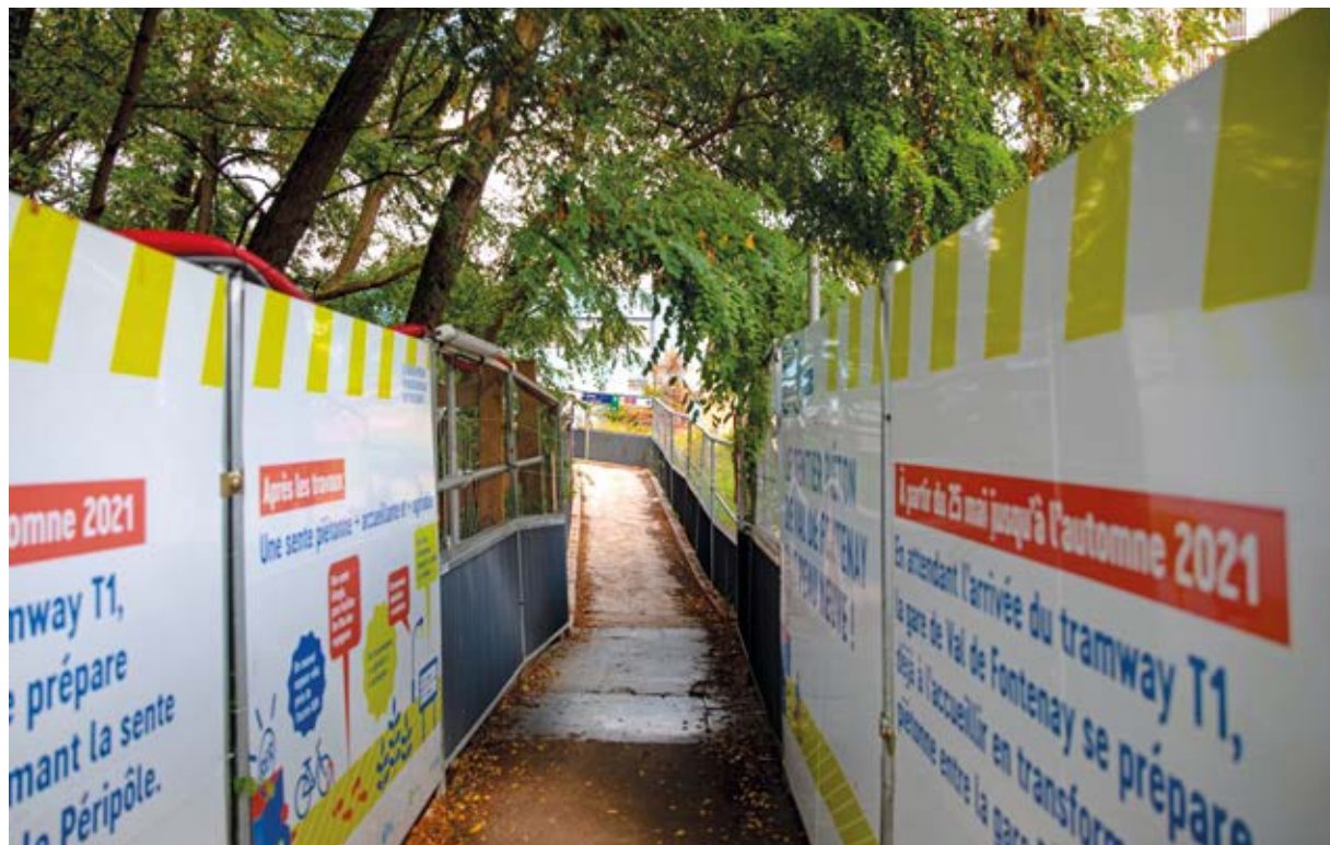
Les travaux ont débuté le 25 mai et se termineront, normalement, cet automne.