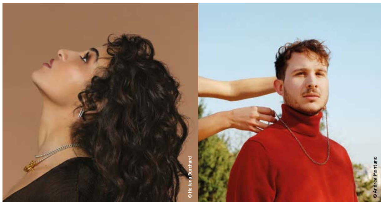
Le 2 octobre, à 20h, la salle Jacques-Brel accueille Camélia Jordana et Fils Cara !

MUSIQUE. Après une édition 2020 quelque peu bousculée par la crise sanitaire, avec son petit lot de concerts annulés, la 35 e édition revient en force et au grand complet. Le Festi'Val de Marne, rendez-vous incontournable de la rentrée musicale et culturelle en Île-de-France, est programmé dans 26 villes et une quarantaine de lieux, du 1 er au 23 octobre. Festival consacré à la chanson française ainsi qu'aux musiques actuelles, c'est aussi « Les Refrains des Gamins », spécifiquement destiné au jeune public (dès 4 ans), et la JIMI, la Journée des Initiatives Musicales Indépendantes.