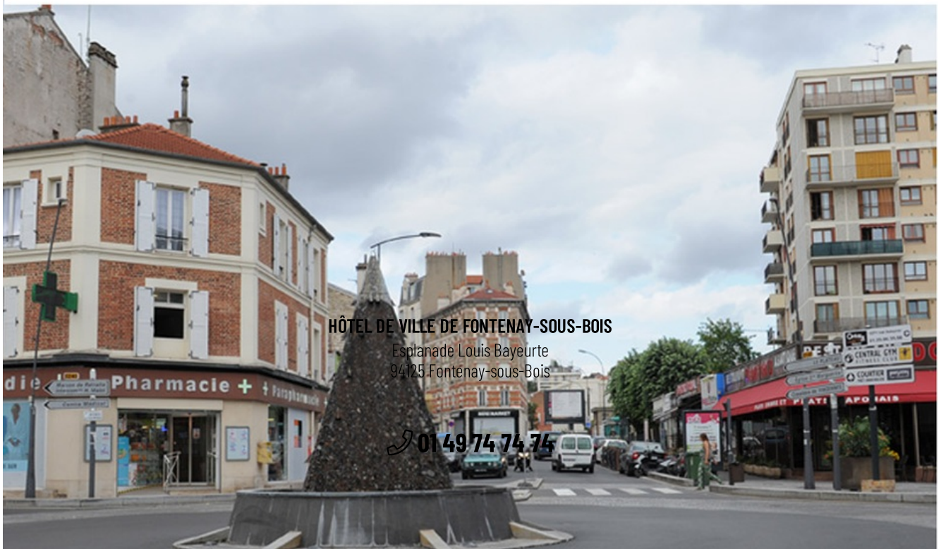
AVENUE DE LA RÉPUBLIQUE 1930