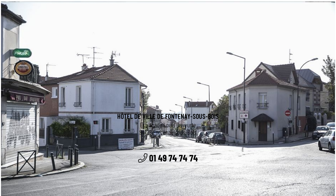
AVENUE DANTON ET AVENUE PARMENTIER 2020