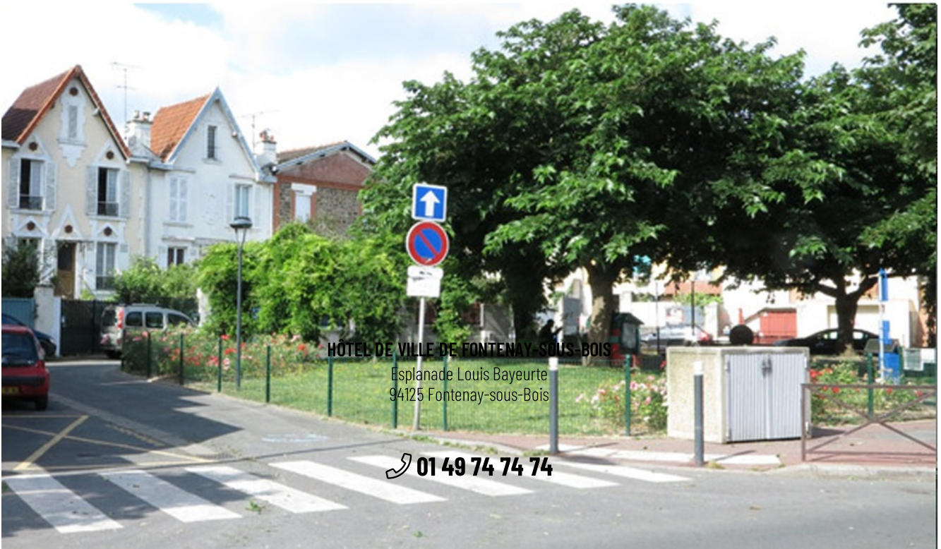
PLACE MICHELET 1904