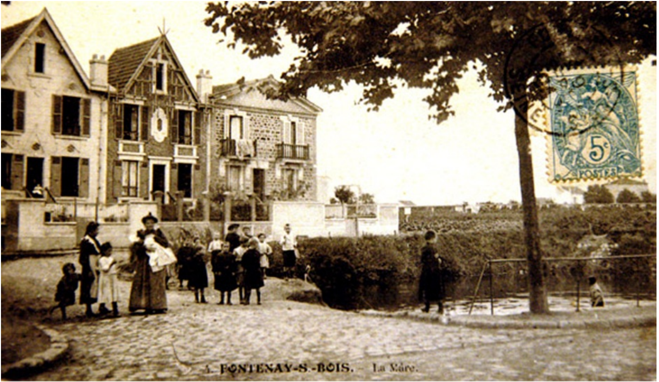
1. FONTENAY-S.-BOIS. — La Mère.