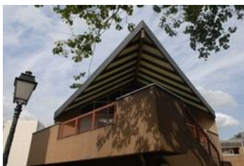
Crèche municipale Grands chemins