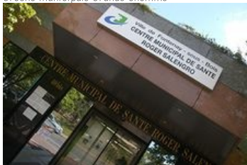
Centre municipal de santé Roger Salengro