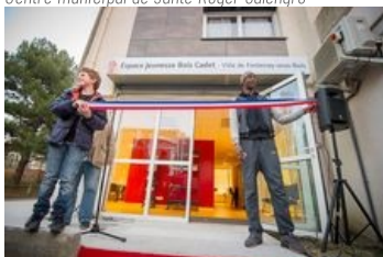
Antenne jeunesse Bois Cadet