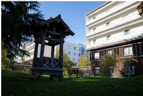
Maison de retraite intercommunale Hector Malot