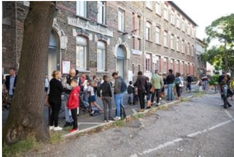
Écoles Jules Ferry