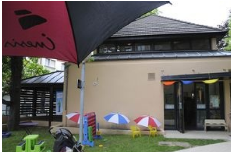
Ludothèque des Parapluies